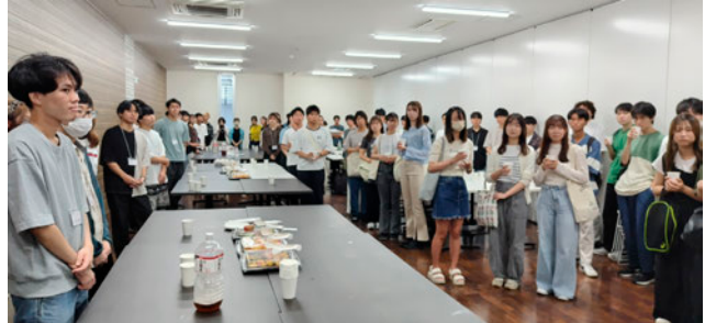
懇親会開催の様子