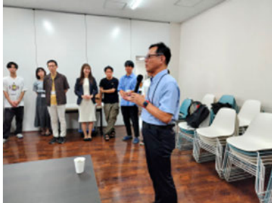
懇親会でのご挨拶

下記の日程において、尚醸会からの補助と、生物工学専攻の基幹・協力講座の教授の先生方からのご厚志をいただき、開催しました。各研究室からも2-3名の在籍している学生さんにも参加して頂き、2年生と上級生、教員との交流も含めて、多くの学生さんのご協力があり、おかげさまで、大変盛況な会となりました。どうもありがとうございました。