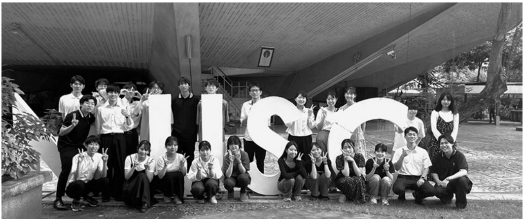
2024年度SSSVプログラムの様子（最終成果報告会後の集合写真）

しかし、コロナ禍後は、国際線の減便と円安によるフライト代の高騰、また感染症防止のための宿泊施設の確保やより充実した海外旅行保険への加入が求められており、参加学生の経済的負担が大きくなってまいりました。こうした背景のもと、2023年度には尚醸会から総額360,000円のご支援を賜っております。2023年度のプログラムでは、実施期間中、8割ほどの学生が、新型コロナウイルスあるいはインフルエンザに感染するという非常事態に見舞われましたが、尚醸会のご支援のもと充実した内容の保険に加入していたことにより、無事にプログラムを完遂することができました。かかる状況から2024年度のプログラムでも408,000円のご支援を賜りましたことをご報告申し上げます。2024年度のプログラムでも若干名が風邪や腹痛の症状を訴えることがありま