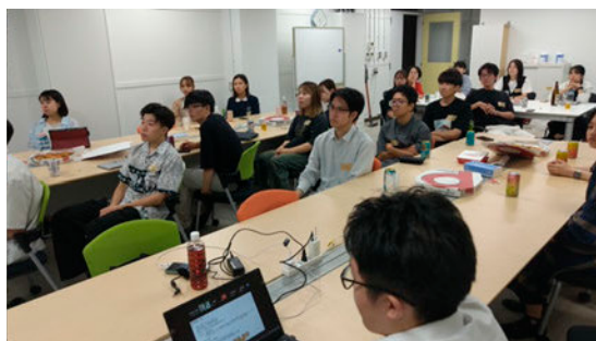
尚醸会 OB・OG 交流会のスナップショット